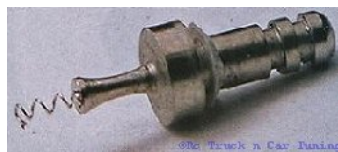
electrocul si filamentul